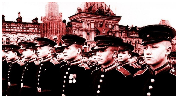
Суворовцы во время Парада Победы 24 июня 1945 года

В августе 1943 года было вынесено постановление об организации закрытых военных училищ, имеющих целью дать воспитанникам общее среднее образование и вместе с тем подготовить их к военной службе в офицерском звании. Эти училища получили название суворовских. То обстоятельство, что учебным заведениям присвоено имя великого русского полководца, имеет глубокий смысл. Оно подчеркивает, как чтит наша страна и русский народ Александра Васильевича Суворова и его традиции.