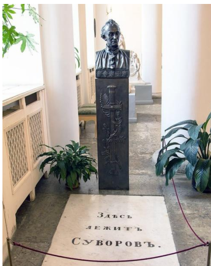
Могила А.В. Суворова в Александро-Невской лавре Санкт-Петербурга

теперь». А перед самой смертью, причастившись Святых Христовых Таин, Суворов произнёс полные истинного смирения последние в своей жизни слова: «Долго гонялся я за славой - всё мечта. Покой души - у Престола Всевышнего».