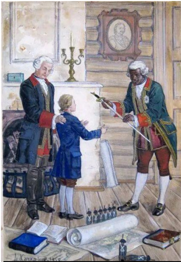
Александр Суворов и Ганнибал

Необыкновенную выносливость юного Саши, его рвение при изучении военного дела заметил друг Василия Ивановича Суворова Абрам Ганнибал, «арап Петра Великого», прадед А.С. Пушкина. Именно генерал Ганнибал посоветовал отцу отправить юношу не на гражданскую, а на военную службу.