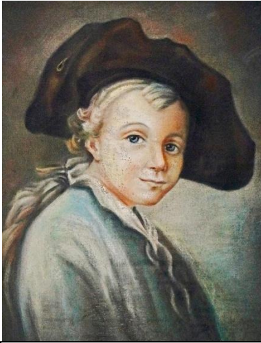
Юный Саша Суворов